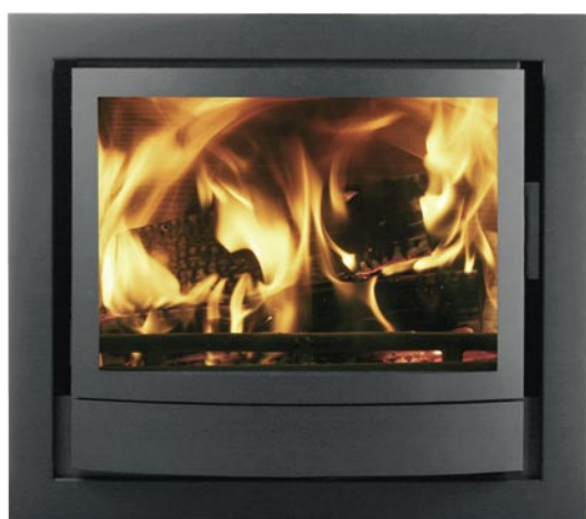
IT43 - Graphite

Ancora più calore radiante in casa vostra, grazie all'altezza del modello ITH. Una cornice in nickel può essere fornita opzionalmente con gli inserti IT e ITH.