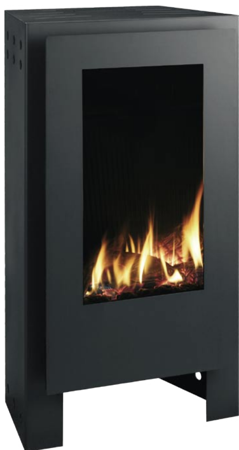
FH34 - Graphite